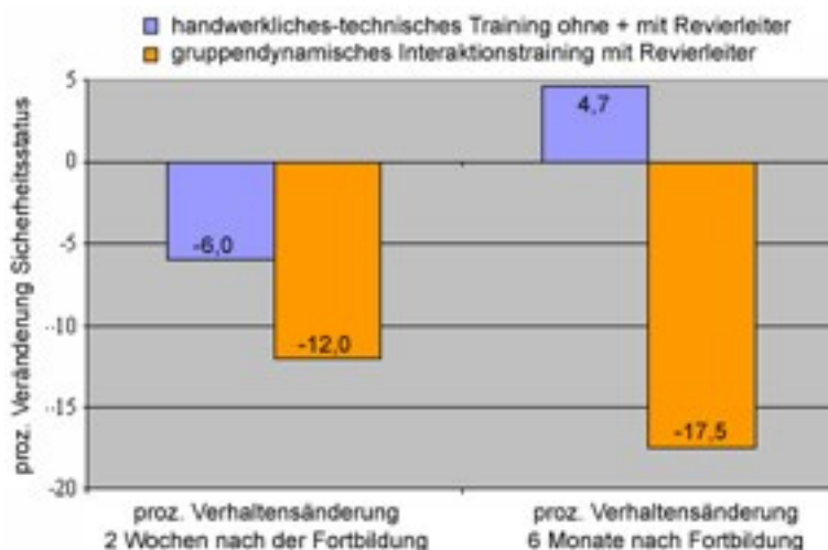
Abb.1 Prozentuale Veränderung des Sicherheitsstatus bei Fortbildungen mit und ohne handwerklichen Inhalt